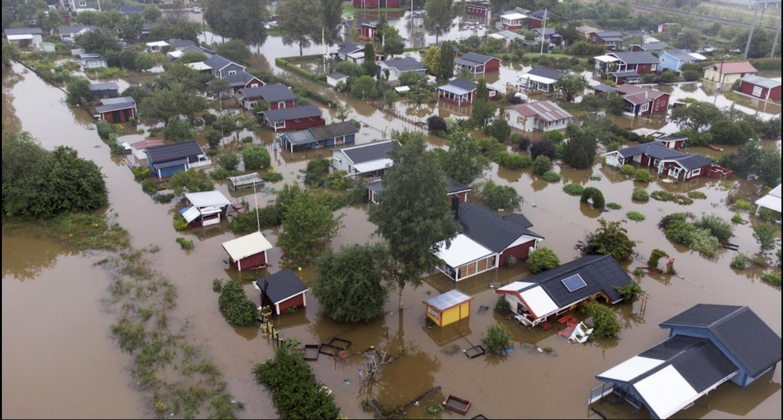
Ett av de områden som är mycket hårt drabbade av översvämningar är södra Koloniområdet i Gävle.